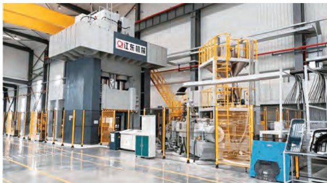
复合材模压成形技术与产线

对于公司而言, 国家级专精特新“小巨人”称号既是一份难能可贵的荣誉, 也是一项心向往之的责任。公司将以本次获得国家专精特新“小巨人”企业资质为契机, 加快创新步伐, 进一步提升企业专业化能力和水平, 继续发挥“补短板”“填空白”的关键性作用, 为稳定产业链供应链提供有力支撑, 全力推动经济高质量发展。