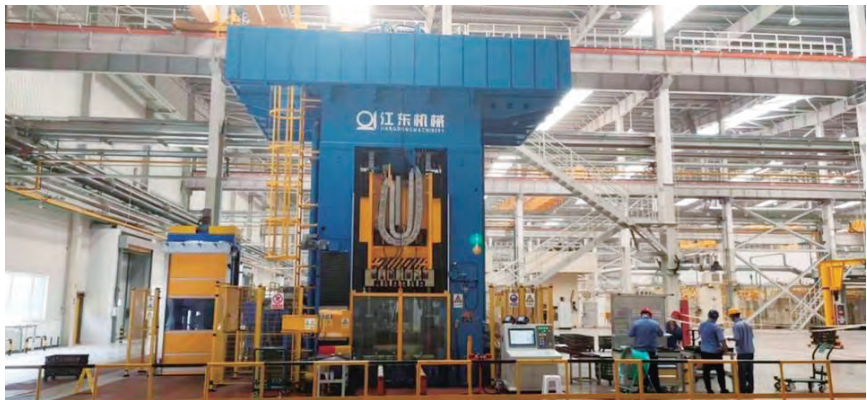
多工位成形技术与产线

公司一直秉持“敬天爱人, 产业报国”的企业使命。在公司领导的带领下, 聚焦“做国内一流, 能参与国际竞