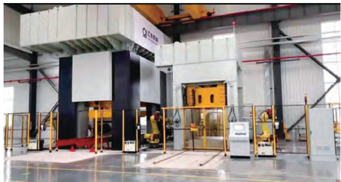
液压成形技术与产线