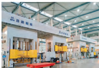
典型产品布局 (HP-RTM工艺)

3. 在复合材料预成型体热压过程中,机械手可以抓取材料周边进行浮动压制。即在压制过程中,机械手可以与滑块随动,满足客户对产品工艺的要求,保证预成型体的质量。