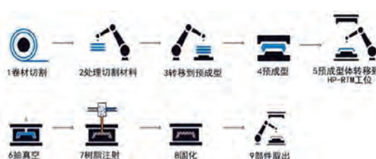
HP-RTM成型工艺流程示意图