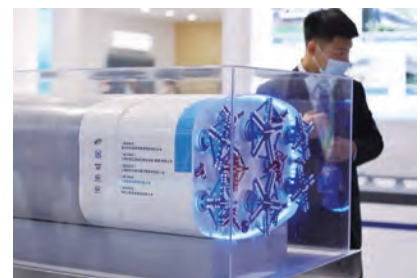
图5 世界最大断面矩形盾构机“南湖号”

“南湖号”盾构机宽14.82米、高9.446米，用于嘉兴市快速路下穿南湖大道工程，解决了超大断面矩形盾构施工一次性开挖成型、主机姿态控制以及土体沉降控制等技术难题，具有不影响交通、不破坏环境、安全高效等特点。2020年10月，“南湖号”盾构机顺利实现全线贯通。