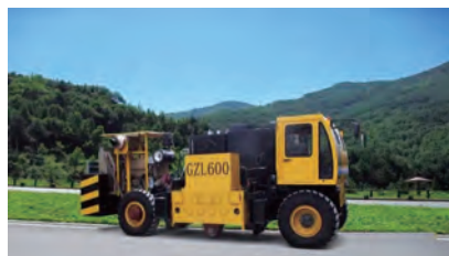
图9 国内首创路面共振破碎机

采用单跨架梁模式, 小车与运梁车上的驮梁台车同步拖拉取梁, 步履式走行过孔。该设备的成功运用标志着我国高铁制架技术迎来第三次大突破。