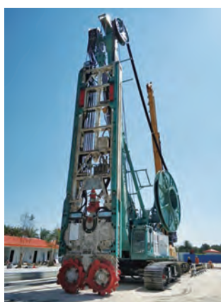
图7 首台国产双轮铣

中铁工业已完全掌握了双轮铣的核心技术, 在完成广州地铁11号线和18号线、深圳春风隧道等项目地下连