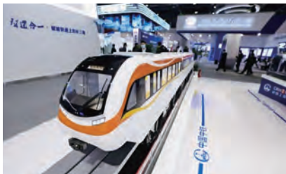
图1 填补EMS技术空白时速200公里磁浮列车

具有适应能力强、安全性能高、运行速度快、噪声振动低、运维成本低、环境污染小等显著优势。