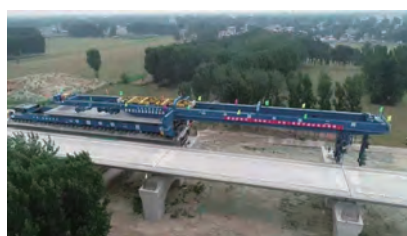
图8 我国高铁首套40米跨1000吨级架桥机

续墙施工后, 墙体质量、施工进度获得了各界好评, 为国产装备在地下连续墙施工市场树立了一面旗帜。