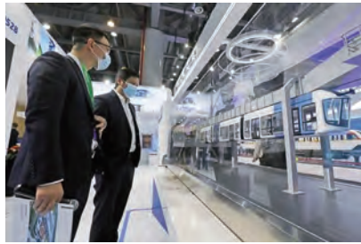
图2 具有无人驾驶功能的悬挂式列车(空轨)

具有适应能力强、安全性能高、运行速度快、噪声振动低、运维成本低、环境污染小等显著优势。