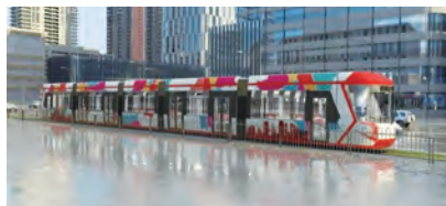
图4 现代化、大容量、低地板氢能源有轨电车