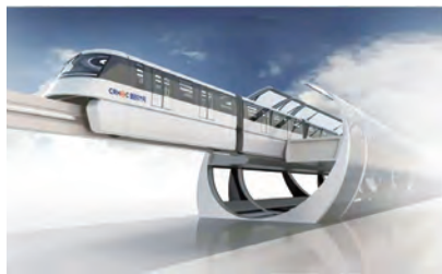
图3 牵引能力强的跨座式单轨列车