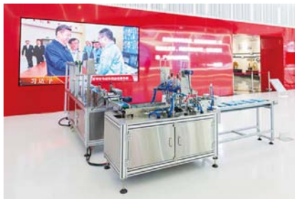
全自动口罩机在安徽创新馆主馆展出

合锻智能在新冠肺炎疫情初期即展现出了智能制造企业的实力、效率和担当。面对口罩及生产设备价格飙升、交货周期长的现状,合锻智能联合中国科学技术大学俞书宏院士专家团队成立应急攻关组,开展了“微纳复合防护抗菌新材料及装备研制”,仅用10余天时间就开发设计制造出全