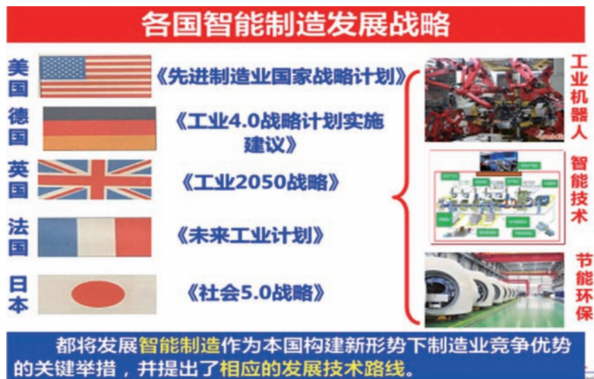
图1-1 各国智能制造发展战略

《中国制造2025》从国家层面确定了我国建设制造强国的总体战略，明确提出：要以创新驱动发展为主题，以新一代信息技术与制造业深度融合为主线，以推进智能制造为主攻方向，实现制造业由大变强的历史跨越。